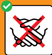
Hände schütteln vermeiden.