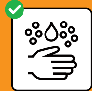
Gründlich Hände waschen.