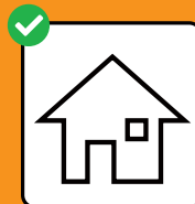
Bei positivem Test: Isolation. Bei Kontakt mit positiv getesteter Person: Quarantäne.