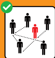
Zur Rückverfolgung immer vollständige Kontaktdaten angeben.