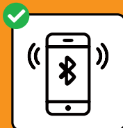
Um Infektionsketten zu stoppen: SwissCovid App downloaden und aktivieren.