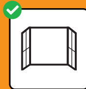
Mehrmals täglich lüften.