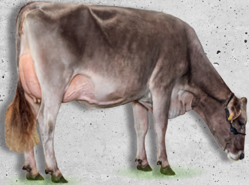
ZROTZ Brice VERA